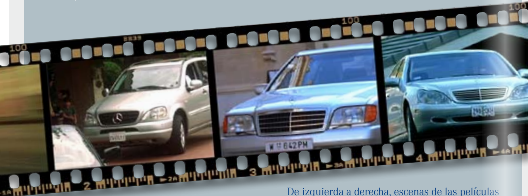
De izquierda a derecha, escenas de las películas "Traffic", "The Peacemaker" y "Bandits"