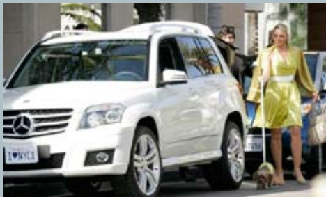
Kim Cattrall en "Sex and the City".

► A lo largo de los años, la relación de Mercedes-Benz con el cine ha evolucionado y se ha destacado en producciones de alto nivel, como las recordadas "The Peacemaker", "Bandits", "Traffic", "Devil wears Prada", y en los últimos tiempos con la presencia más directa con promociones a nivel mundial con el caso de "National Treasure: The Book of Secrets" con la que se desarrolló una "búsqueda del tesoro" global on-line cuyo premio final fue un Clase C y en la última "Sex and the City", en donde las cuatro mujeres más famosas de Nueva York incluyen entre sus más glamorosos accesorios la Clase S y la Clase GLK, próximamente a ser lanzada en el mercado local. Mercedes-Benz y el cine, una fórmula infalible.